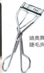
迪奧舞台搶眼睫毛夾，Dior