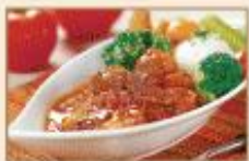
匈牙利牛肉 215g/包 · 15包/箱