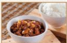
醃釀香滷肉汁 180g/包 · 25包/箱