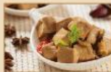
榨菜豆干 150g/包, 50包/箱