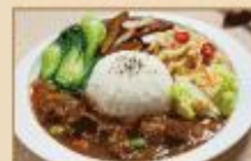
辣味紅燒牛腩 300g/包, 40包/箱