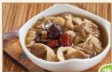
鮮菇嫩素排 350g/包 · 25包/箱