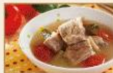
泰式香檸排骨湯 500g/包, 20包/箱