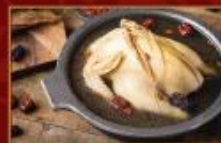
蔘棗養氣鹿野嫩雞 2500g/包 · 6包/箱