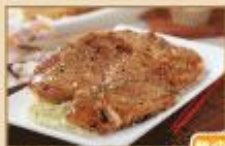
香滷排骨 冷凍生品 195g/包，48包/箱