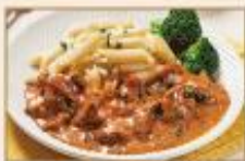
羅馬香草牛肉 230g/包 · 40包/箱