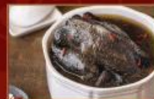
淮山烏骨帝王雞 2400g/包 · 6包/箱