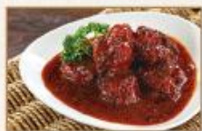
紅谷米燒子排 250g/包 · 30包/箱