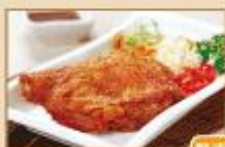
炭爐雞腿 冷凍生品 190g/包，20包/箱