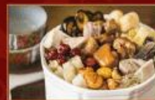
金龍佛跳牆 2200g/包 · 6包/箱