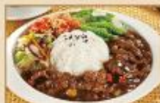
黑胡椒牛肉 300g/包, 40包/箱