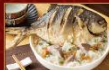
富貴鯧魚炊粉 2550g/包 · 4包/箱