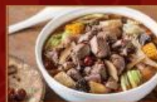
暖心薑母鴨鍋 2100g/包 · 6包/箱