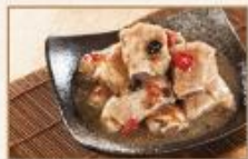
港式豆豉小排 280g/包 · 25包/箱