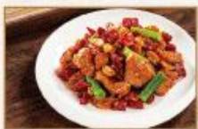
湘川宮保雞丁 180g/包 · 25包/箱