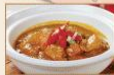
泰式咖哩雞 300g/包 · 35包/箱