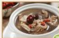
藥膳素食湯 400g/包, 20包/箱