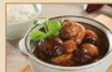
栗子燒雞 265g/包, 20包/箱