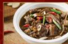
藏書燉羊肉 1000g/包 · 10包/箱