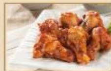
紐奧良翅小腸 30支裝/包，6包/箱