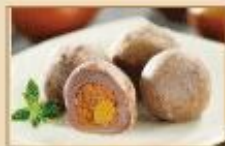
香酥芋泥丸 12顆裝/盒，8盒/箱