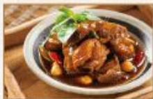
家鄉三杯嫩雞 300g/包 · 25包/箱