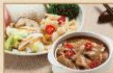
沙茶豬肉 300g/包, 40包/箱