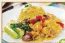
山藥南瓜蔬食 280g/包 · 30包/箱