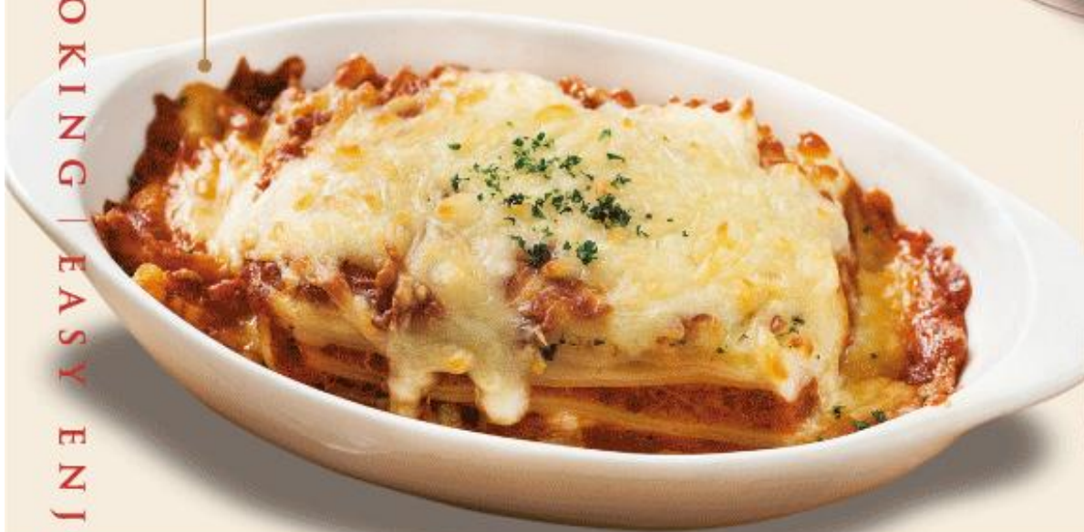
牛肉千層麵 265g/包 · 30包/箱