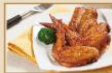
紐奧良二節翅 30支裝/包，6包/箱