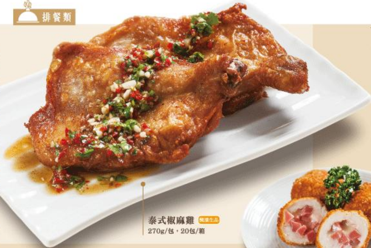
泰式椒麻雞 冷凍生品 270g/包，20包/箱