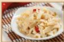
滷筍絲 600g/包, 18包/箱