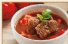
蕃茄牛肉湯 500g/包, 25包/箱