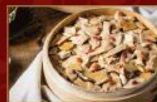
麻油松阪清水米糕 1000g/包 · 8包/箱