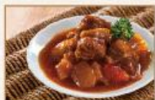
鮮茄煲牛腩 300g/包 · 25包/箱