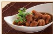
QQ燒豬腳 400g/包 · 20包/箱