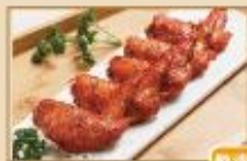
二節翅 冷凍生品 30支裝/包，4包/箱