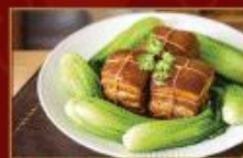
紹興東坡肉 700g/包 · 18包/箱