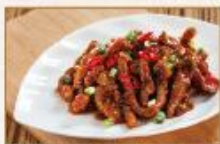
麻婆魚香肉絲 270g/包 · 25包/箱