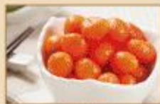
梅汁紅蘿蔔球 500g/包, 10包/箱