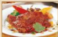
墨西哥香烤雞腿排 170g/包，15包/箱