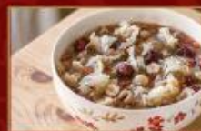
銀耳蓮子桂圓釀 1000g/包 · 12包/箱