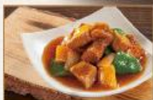
蜜汁咕咾肉 300g/包 · 25包/箱