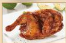
羅馬烤半雞 460g/包，20包/箱