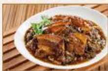
北埔梅干扣肉 280g/包 · 25包/箱